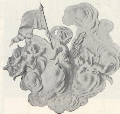
Saaldecke im Hauptsteueramt.

Stock besitzen theilweise Gasbeleuchtung. Die Wohn- und Diensträume des zweiten Stockes haben electricisches Lätewerk. In den Höfen befinden sich laufende Brunnen, welche von der städtischen Mösleleitung gespeist werden.