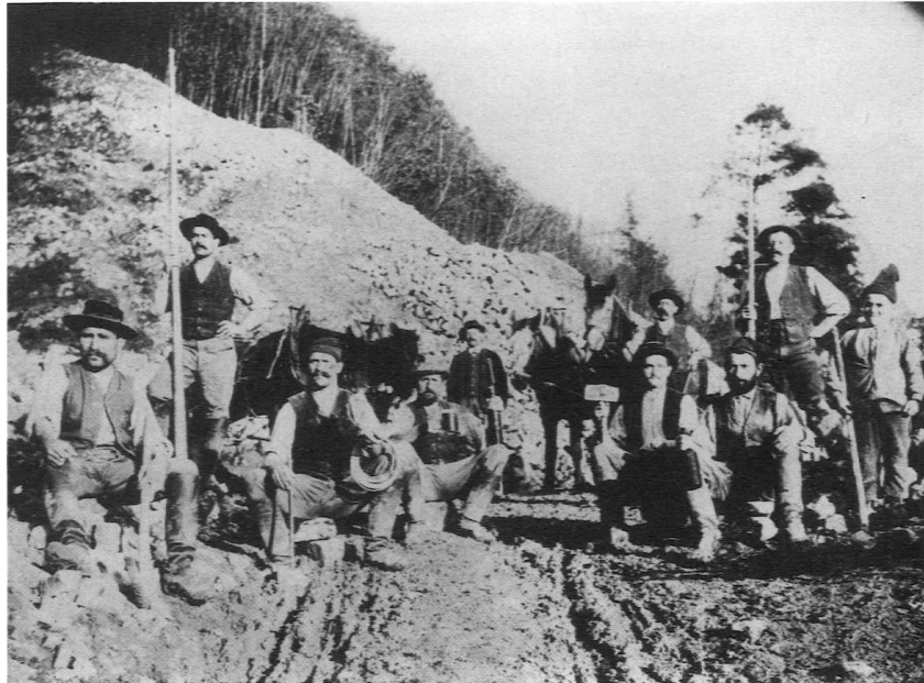
Abb. 5: Im Steinbruch beim Hornfelsen (um 1900)