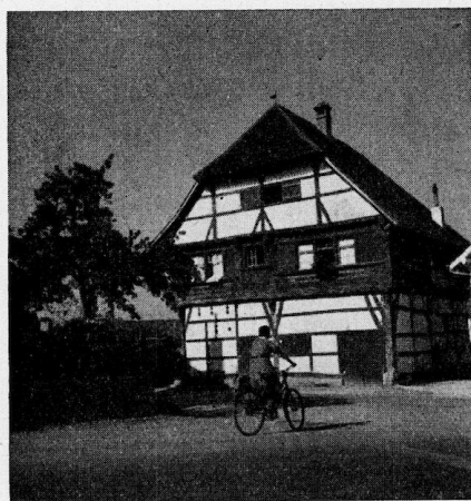
Abb. 46. Haus aus Immensstaad.

Die so erheblich gesteigerte Dachlast, die damit noch größere Beanspruchung durch das Wetter im Verein mit der Notwendigkeit, Holz zu verarbeiten, bedingten ein Einfühlen in die wirkenden Kräfte, einen