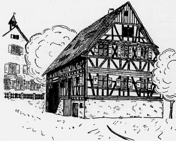
Abb. 60. Zell-Weierbach, Haus Nr. 61.