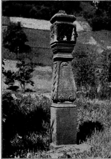
Bild 5. Dreikönigsbildstöck bei Wolfach.