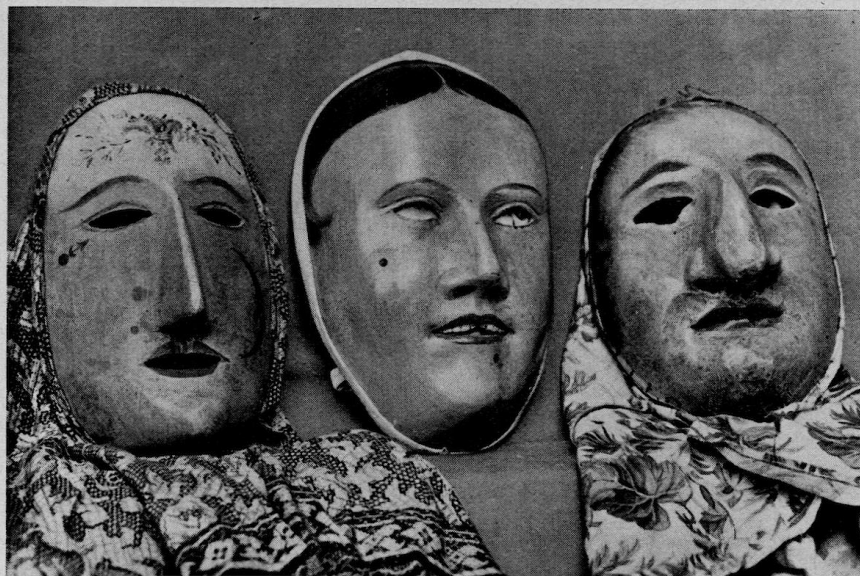
Älteste vorhandene Holzlarven, 18. Jahrhundert, Anfang 19. Jahrhundert