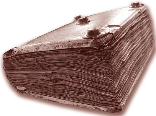
Bild oben: Das Buch der Schenkungen