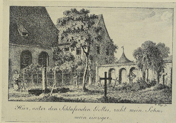
Das Grab von Fritz Jacobi. Titelkupfer der Iris 1813.

So reizend aber dieser Platz, den ich dir, mein Teuerster, nur unvollkommen beschrieben habe, mit dem angrenzenden, auf einer tiefen Abstufung liegenden Garten, ist, so bekommt doch alles