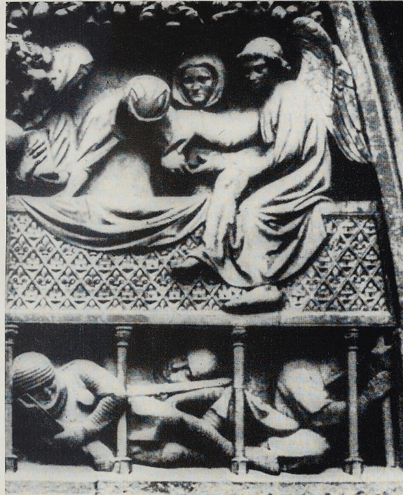
Abb. 8 Sarkophag des auferstandenen Christus im Tympanon des Westportals des Straßburger Münsters, 15. Jahrhundert.