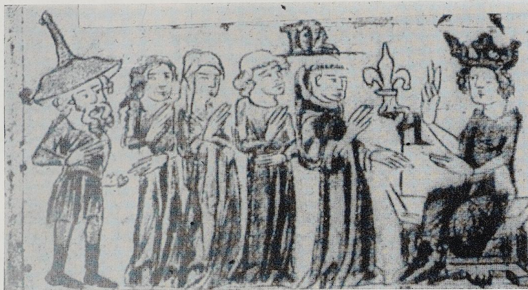
Abb. 19a Illustration der Dresdener Bilderhandschrift des Sachsenspiegels zu Landrecht II, 66, § 1, 14. Jahrhundert: Wirkung des Friedens durch den König für Pfaffen und Geistliche Leute, Frauen, Mägde und Juden.